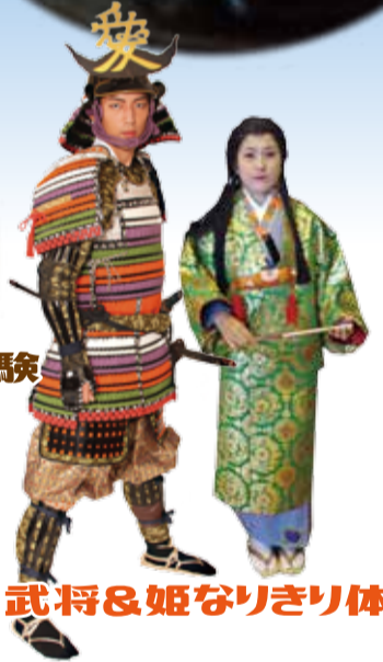
戦国武将&姫なりきり体験