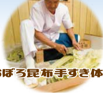
おぼろ昆布手すき体験