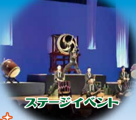
ステージイベント