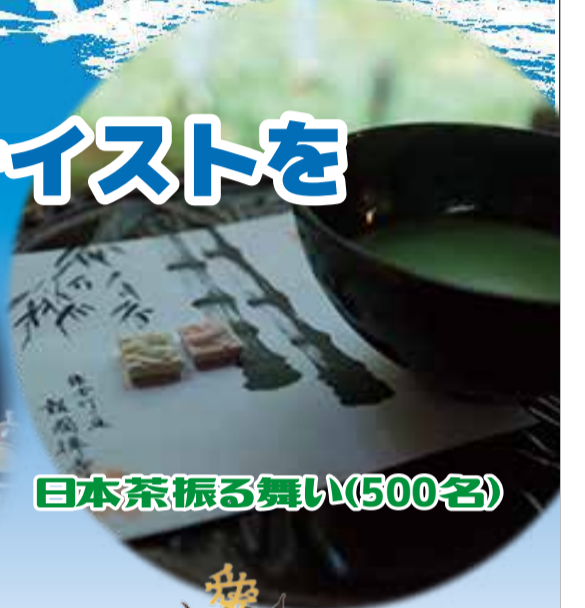
日本茶振る舞い(500名)